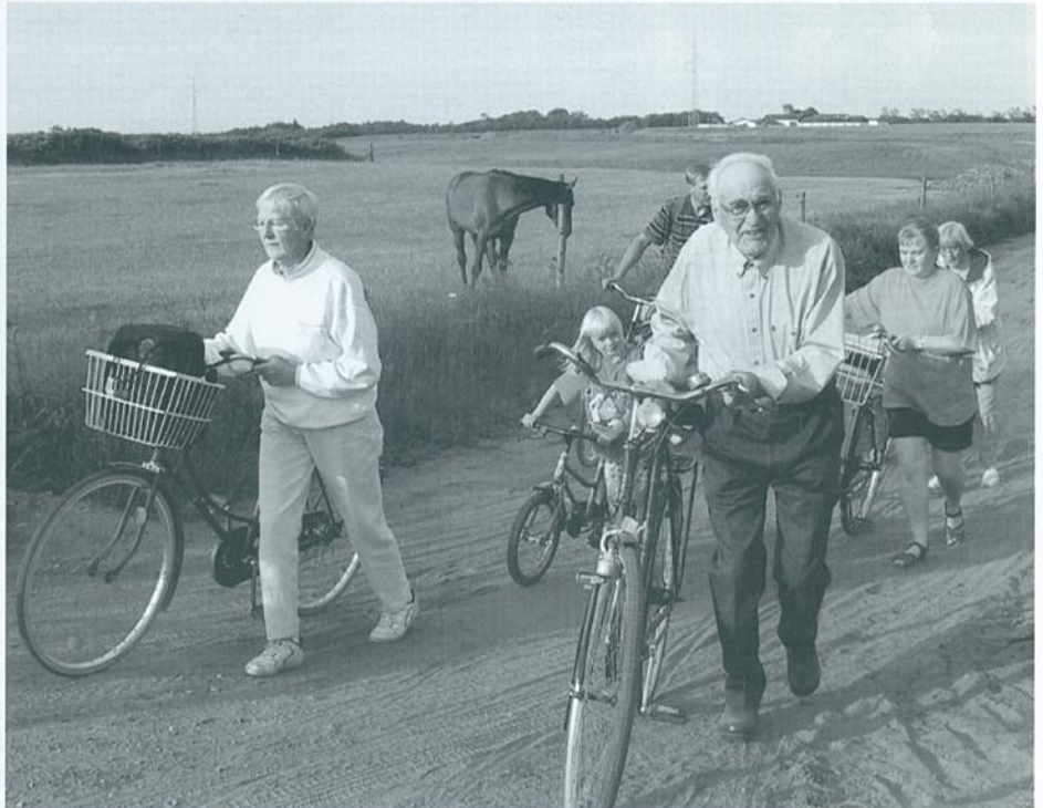
På vej op fra motorvejen ved Krogholm var der brug for alle hestekræfter.

Vi kunne køre hjem i den lune og lyse sommeraften nogle gode oplevelser rigere.